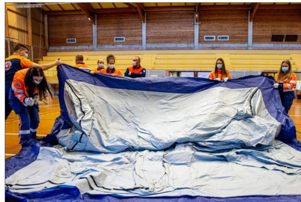
Des démonstrations ont ponctué la journée.

Un peu plus tard dans l'après-midi à la salle de sport d'Oberhoffen, c'est un exercice d'installation de centre d'accueil qui est mis en œuvre. L'occasion pour les jeunes qui rejoignent la Protection Civile d'effec-