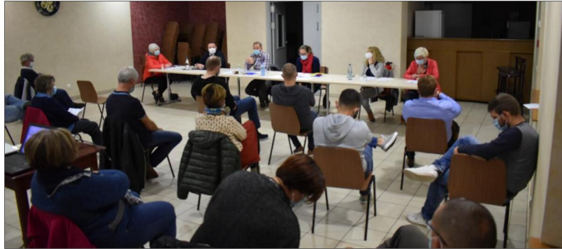
Avec 350 membres, le cercle Aloysia est une des plus importantes de Soufflenheim.

Respect des gestes barrières, port des masques, assemblée limitée à une trentaine de personnes, c'est bon gré mal gré que le cercle culturel et sportif Aloysia a tenu son assemblée générale ordinaire, jeudi 8 octobre au club-house. Pas de grandes annonces vu la situation sanitaire peu lumineuse.